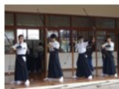
昨年度の大会の様子